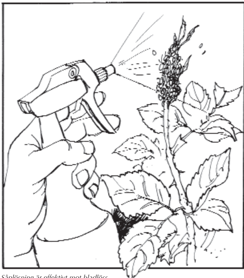
Såplösning är effektivt mot bladlöss.

Skadegörare i trädgården, Boel Sandskär, Prisma 2006.