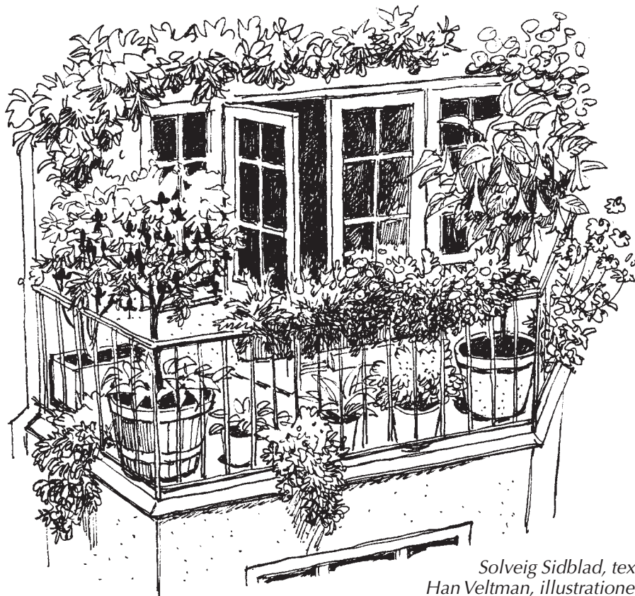
Solveig Sidblad, text Han Veltman, illustrationer

När säsongen är över för ettåringarna är det dags att tömma odlingskärlen och rengöra dem ordentligt inför vinterförvaringen. Jorden kan återanvändas som krukjord om den blandas med gödsel, kompost eller ny jord men också komma väl till pass som jordförbättring eller inblandning i komposten.