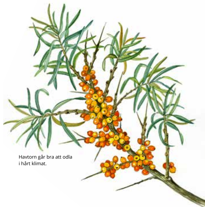
Havtorn går bra att odla i hårt klimat.

Fråga alltid efter svenskodlade och norrlandsanpassade växter i plantskolan. Plantor av samma växtslag kan ha betydligt olika härdighet beroende på var ursprungsplantan härstammar ifrån. I handeln finns numera ett sortiment med växter som har Norrlandsursprung. E-planta är också ett kvalitetsmärke som borgar för sundhet, sortäktighet och härdighet.