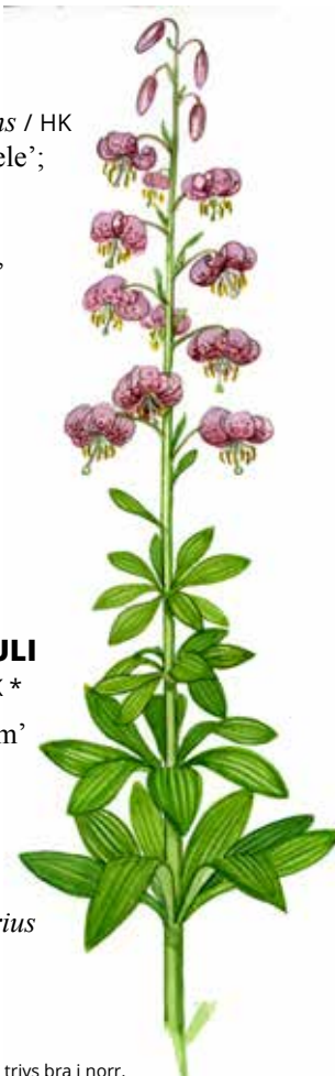
Krollilja trivs bra i norr.

schersmin: doft-, Philadelphus coronarius