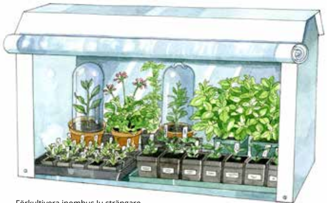
Förkultivera inomhus. Ju strängare vintrar desto fler växtslag kräver förkultivering inomhus.

I växthus kan man odla aubergine, gurka, melon, tomat, paprika, chili och pumpa.