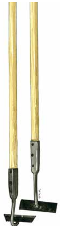
Skyffeljärn för rensning av ogräs.

Ogräsättika är ett miljövänligt ogräsmedel som har god effekt mot fröogräs, men vänta inte för länge, bästa resultatet får man när plantorna är små. Upprepade behandlingar kan hjälpa även mot rotogräs. Spruta/duscha ut ca 2 dl per m 2 . Ogräsättika får dock inte användas i miljödiplomerade föreningar.