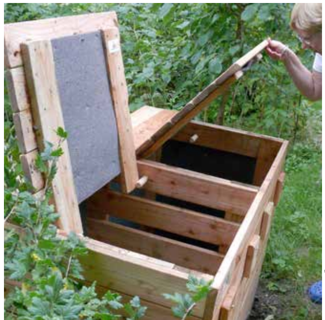
Kompostbehållare med två bingar.

Det får inte vara så blött att det blir syrebrist, innehåller den dessutom mycket kväverikt material från matrester