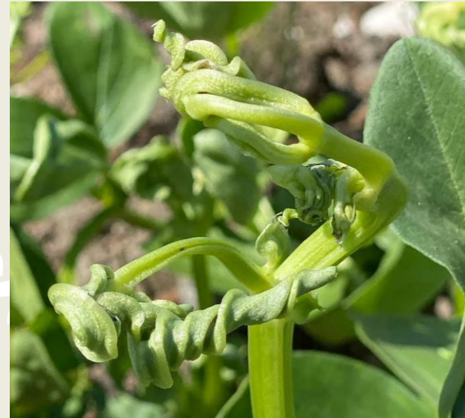
Bondböna med förvridna toppskott pga pyralider.

Det här är fel. Därför har vi startat kampanjen.